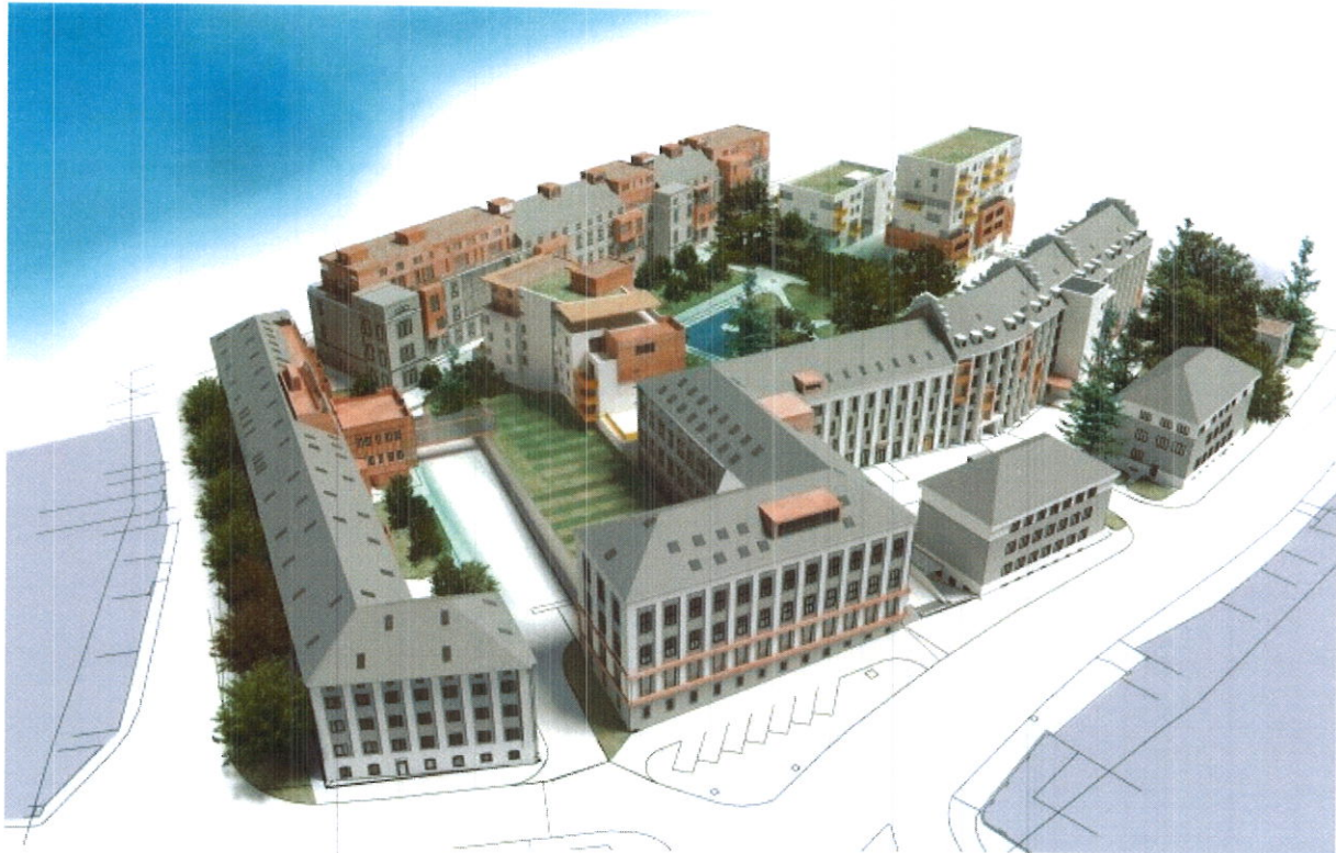
Obrázek 1: Vize konečné podoby areálu Jihlavských Teras